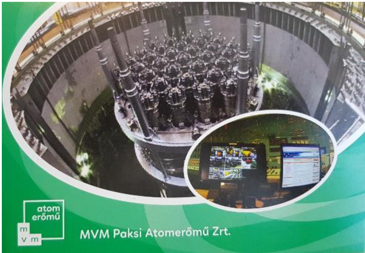
1. ábra - Képeslap az Atomerőműről