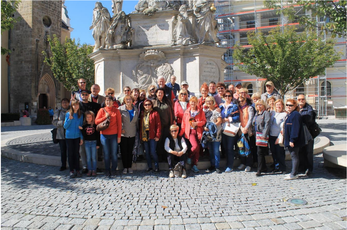
21. ábra- Együtt Sopronban