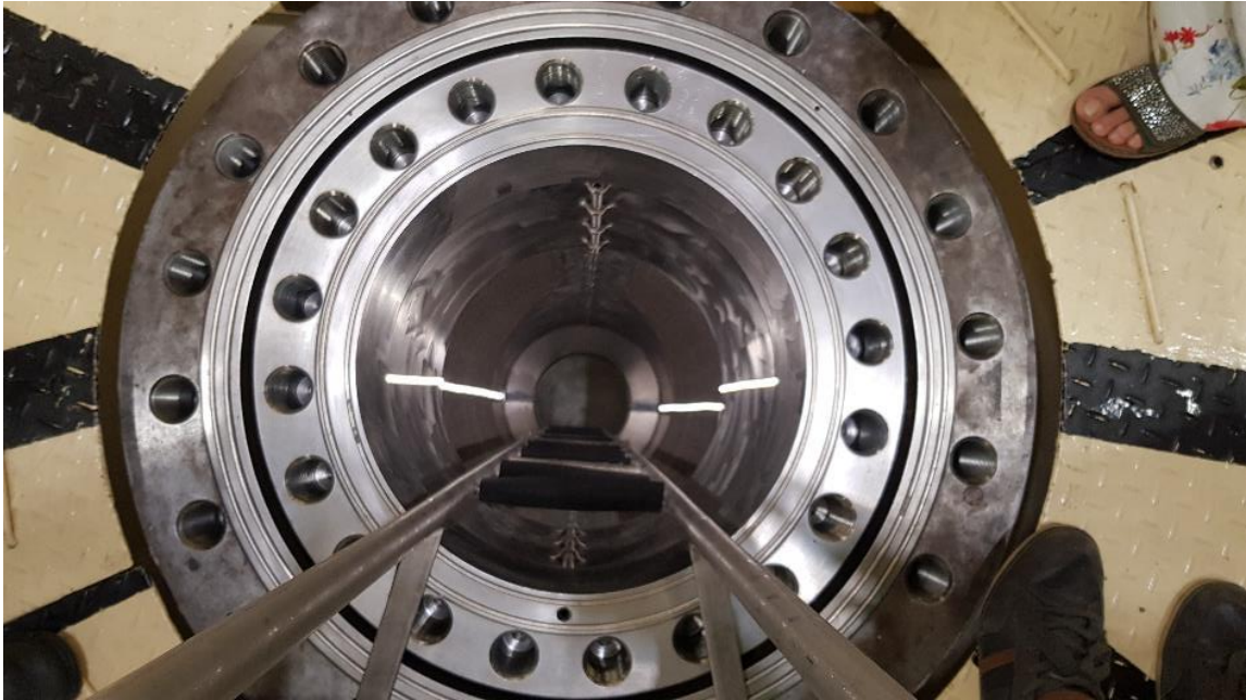
9. ábra - Lejárat a gőzfejlesztőbe