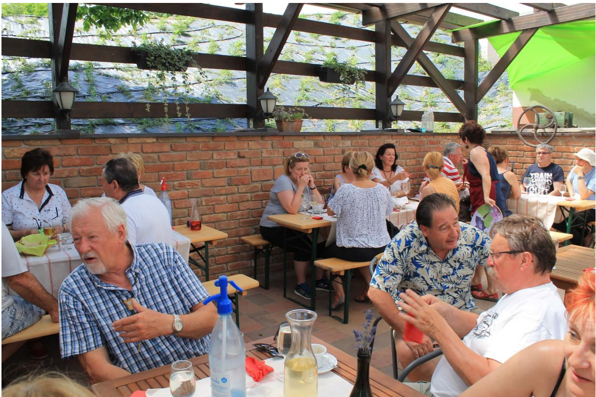
17. ábra - .....az asztalig