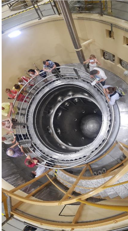
8. ábra - Oktatóközpontban, a reaktor pontos mása