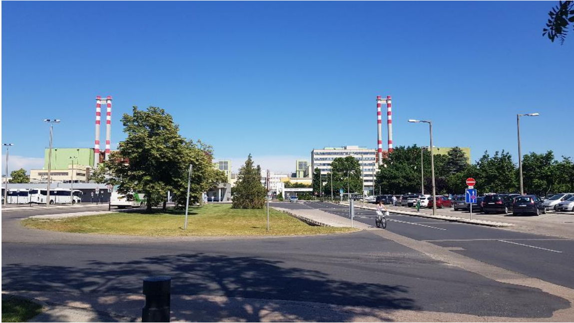
12. ábra – MVM. Paksi Atomerőmű Zrt