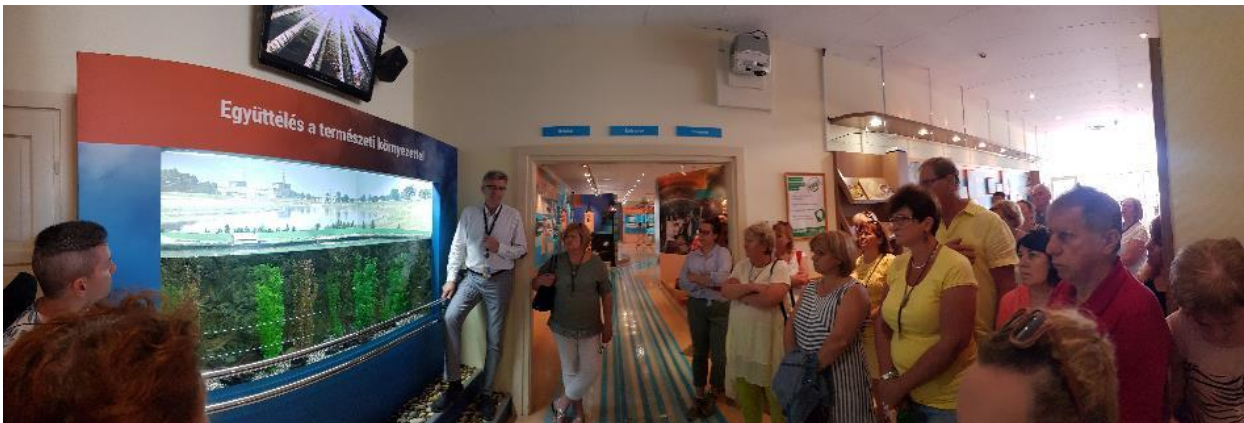
4. ábra – Az egyik csoport