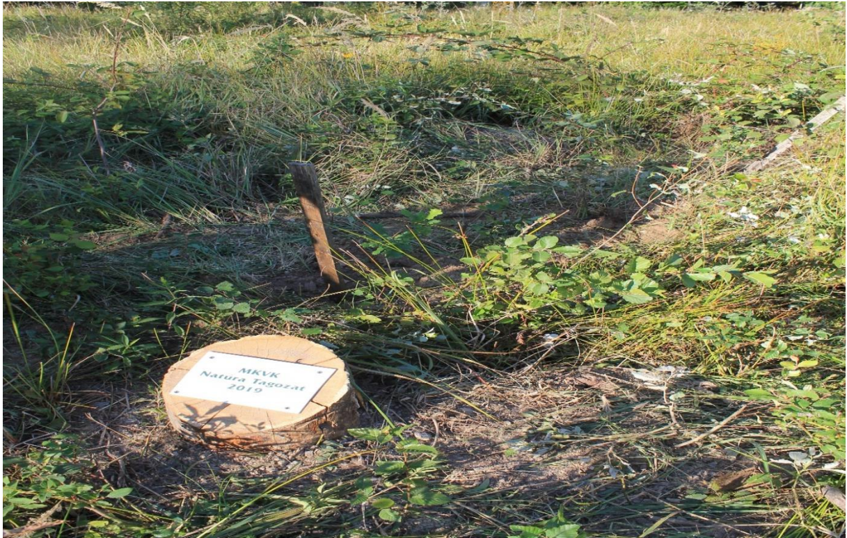
20.ábra- Natura Tagozat faültetési emléktábla – Sopron TAEG Zrt.