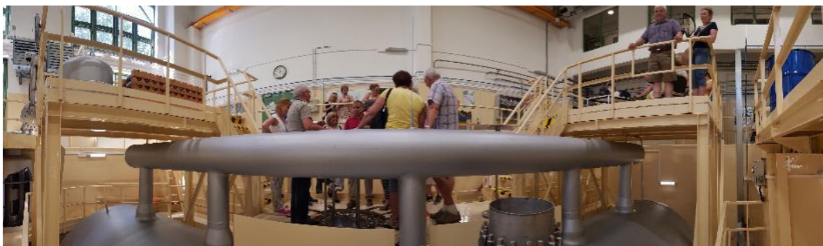
10. ábra - A Gőzfejlesztő tartály kívülről