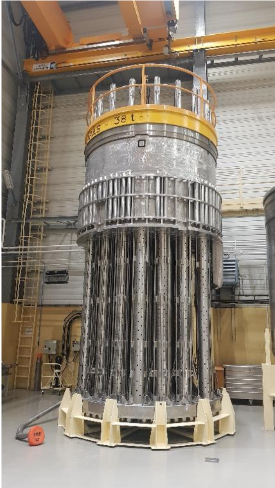
7. ábra - Ebbe kerülnek a kazetták