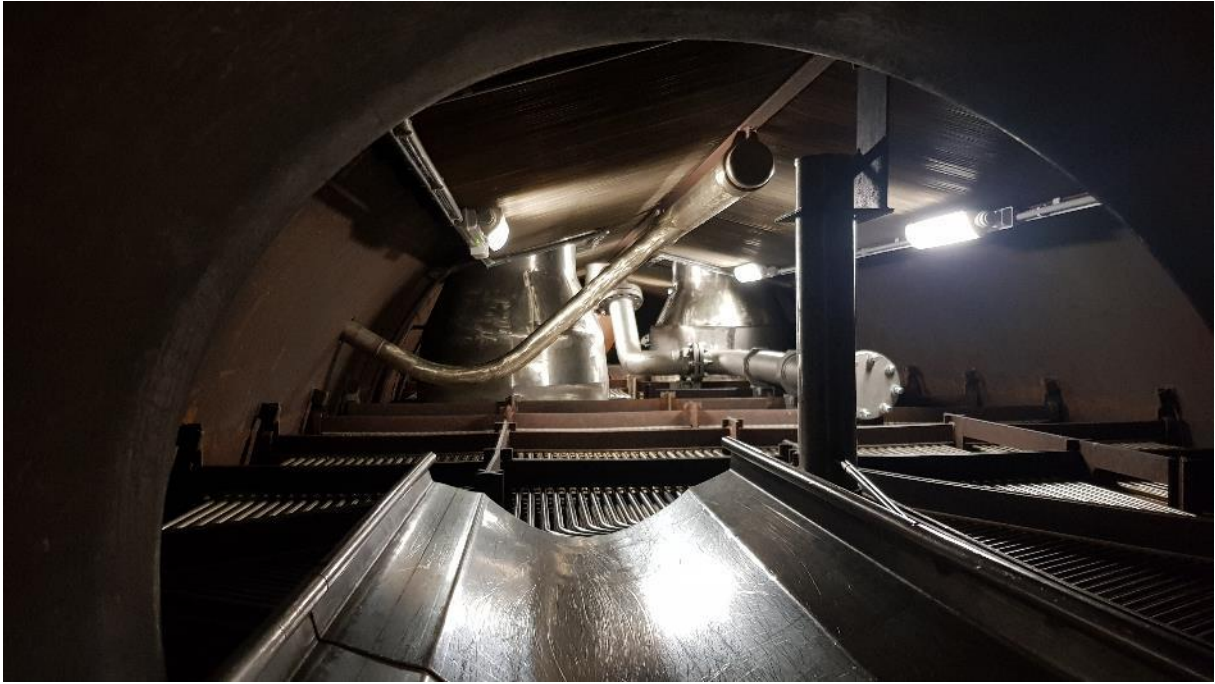
11. ábra - A gőzfejlesztő belülről