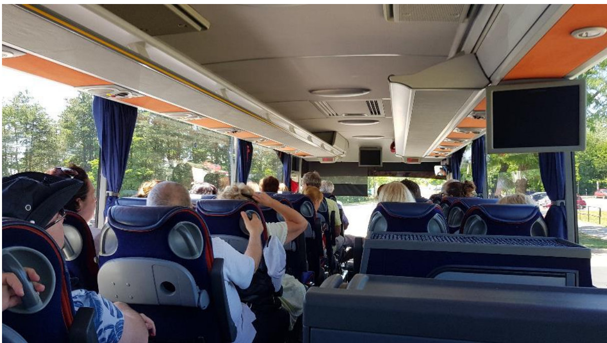
2. ábra – Az Atomerőműben a buszon