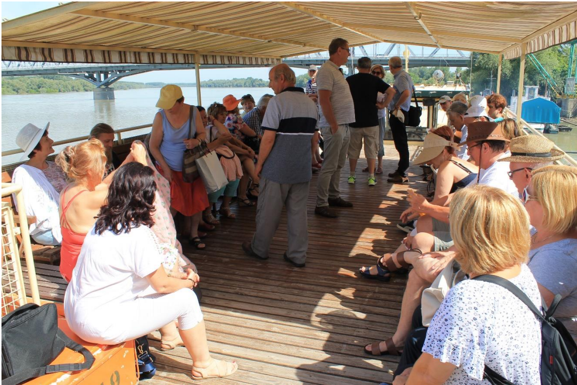
13. ábra – Bemutakozik Hajós - Gemenc (Baja) -Erdészete