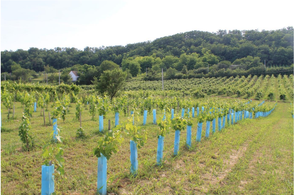
14. ábra – A vesszőtől .....