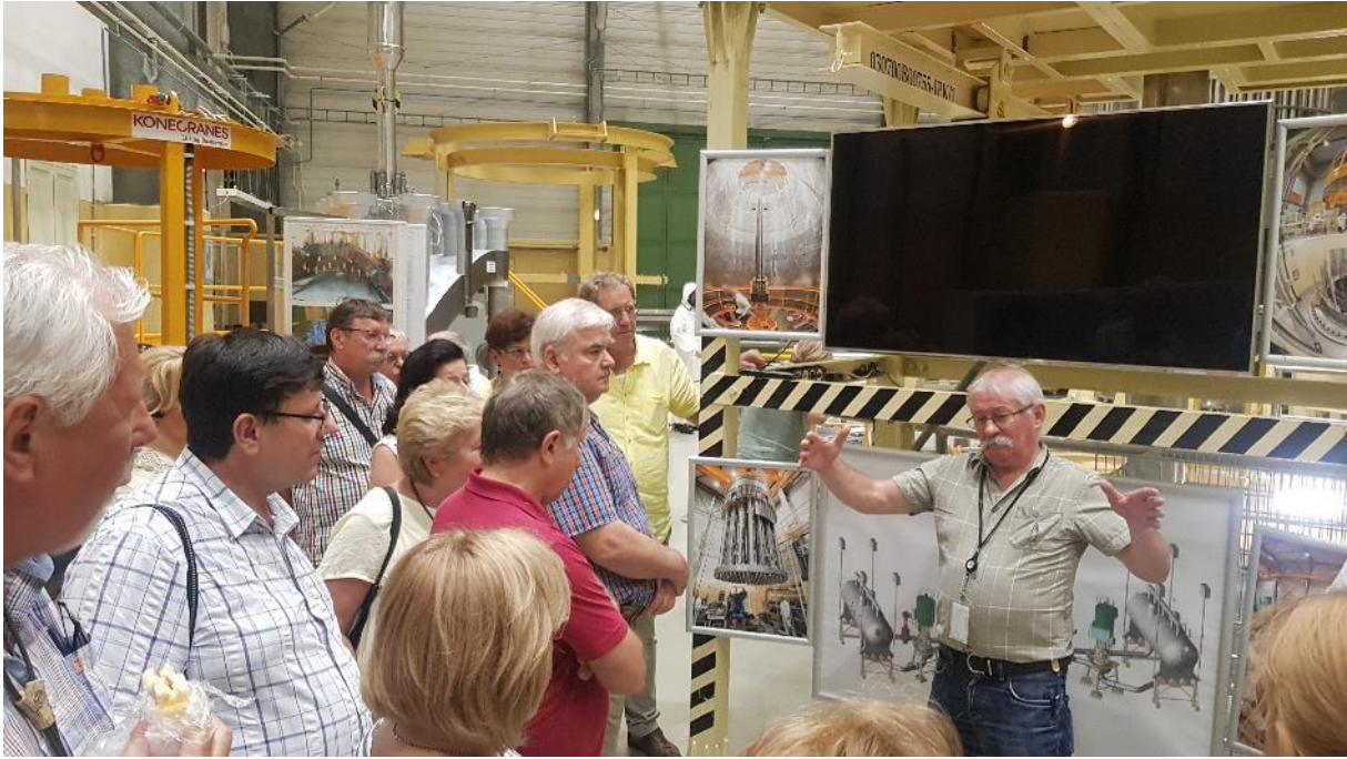
5. ábra - Az oktatóközpontban megnézhattunk mindent közelebbről