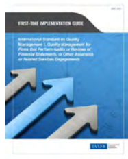
ISQM1 – Firms that perform audits or reviews

Az IAASB júniusban két implementációs segédanyagot tett közzé az új minőségbiztosítási standard csomaggal kapcsolatban. Az útmutatók segítenek az érdekelt feleknek megérteni az új standardokat, és megfelelően implementálni az abban foglalt követelményeket. Az útmutatók a következő linkeken érhetők el: