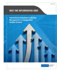
ISQM2 Engagements Quality Reviews

Az IAASB ez év harmadik negyedében fogja közzétenni az ISA 220 (Felülvizsgált) standardhoz kapcsolódó implementációs segédanyagot is.