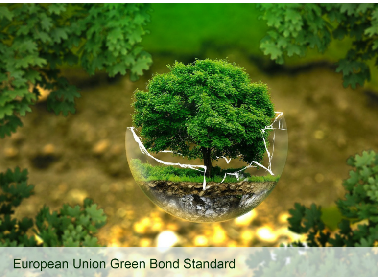
European Union Green Bond Standard

Building a credible Green Bond market (accountancyeurope.eu)