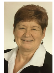
Atkári Árpádné Dél-Alföld