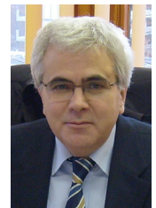
Szöllösi Sándor Észak-Magyarország