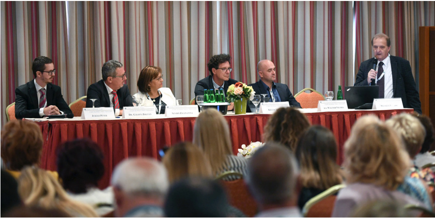
A könyvvizsgálói hálózatokhoz való tartozás előnyeiről folyt megbeszélés a pódiumvitan

Az idei évben két szekcióban, az általános és módszertani szekcióban, folytatódott a munka. Az általános szekció repertoárjában szerepelt a tagi kölcsön és az osztalék kérdései, a konzultációs szolgálat aktuális kérdései, melyet hasznos tanácsok követtek egy generációtudatos szervezet felépítéséhez. Ugyancsak nagy érdeklődés övezte az új pénzügyi technikák rejtjelmeivel foglalkozó pl. Bitcoin, a blockchain, a kriptovaluták és a számítógépek által olvasható beszámolók (XBRL), illetve az általános adatvédelmi rendelettel (GDPR) és az informatika gazdaságra gyakorolt hatásával kapcsolatos előadásokat.