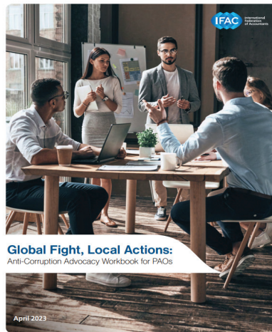
Global Fight, Local Actions: Anti-Corruption Advocacy Workbook for PAOs April 2023

Az IFAC azt is tervezi, hogy a kiadványra építve további kezdeményezéseket indít a kiemelt korrupcióellenes területeken, be-