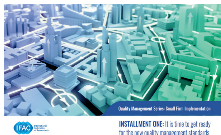
Quality Management Series: Small Firm Implementation INSTALLMENT ONE: It is time to get ready for the new quality management standards

A Könyvvizsgálók Nemzetközi Szövetsége (IFAC) kiadta egy háromrészes kiadványsorozat első részét, hogy segítse a kis- és közepes méretű könyvvizsgáló társaságokat az IAASB új minőségirányítási standardjainak implementálásában. Az IAASB minőségirányítási standardcsomagját 2020 decemberében adták ki, és 2022. december 15-én lép hatályba.