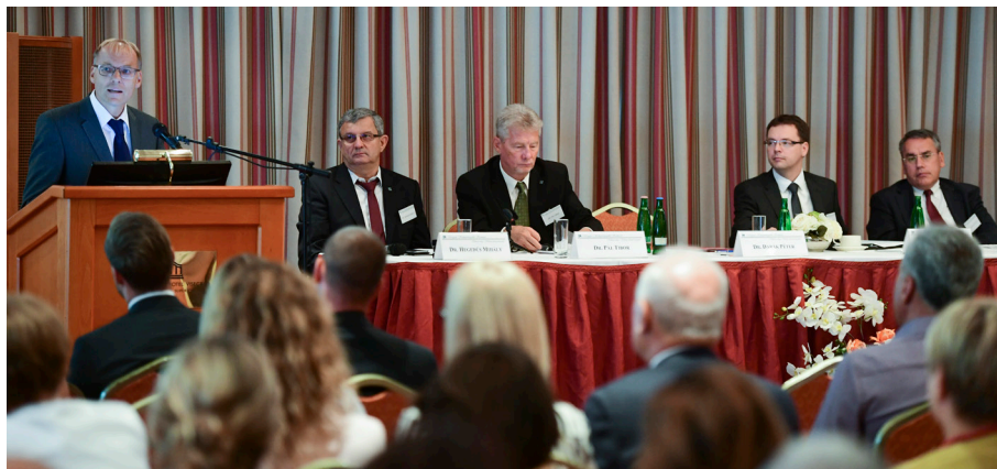
Zsúfolásig megtelt előadóterem a XXVI. Országos Könyvvizsgálói Konferencián

A plenáris ülést követően idén is a megszokott négy szekcióban (általános, módszertani, költségvetési és informatikai) folyt a munka. Az idei évben az érdekesebb és aktuális szakmai kérdéseket bemutató és megvitató előadásokon túlmenően egyre több informatikai témájú előadás bukkant fel mind az általános, mind pedig a módszertani szekció repertoárjában is, de a költségvetési szekció sem maradt el e téren az önkormányzati körökben működő ASP rendszerek bemutatásával. A résztvevők egy gondolatébresztő előadás keretében