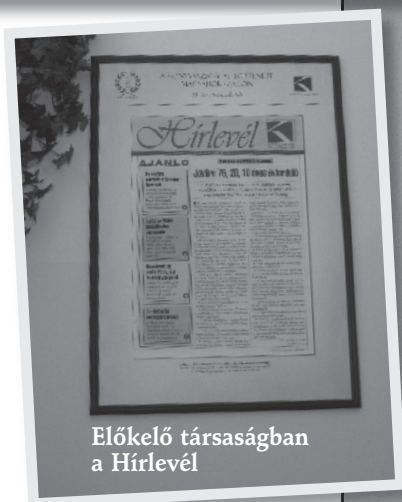
Előkelő társaságban a Hírlevél

A kutatás területei: levéltári dokumentációk, könyvtárakban fellelhető régi folyóiratok, kiadványok, a Számvitel, Adó, Könyvvizsgálat (közismert nevén SZAKma) folyóirat, illetve a szerkesztőség dokumentumai, a kamara irattára, könyvtára, könyvvizsgálók, revizorok megőrzött dokumentumai, fotói, relikviái, a pénzügyi, az igazságügyi és a belügyi tárca joganyagai, egyéb jogtárak. Érdemes megemlíteni, hogy volt olyan dokumentum, amelyet német levéltárban letek fel. A kutatások beindításához jó alapul szolgált dr. Szentkúti László A magyar könyvvizsgálók és a magyar könyvvizsgálat története című könyve ( Saldo pénzügyi Tanácsadó és Informatikai Rt., 1993 ).